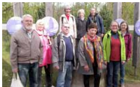
Pilgergruppe auf dem Weg nach Rödermark (Weidenkirche) im Frühjahr 2016

Luther war auf diesem Weg von Wittenberg über Frankfurt zum Reichstag nach Worms unterwegs. Wenn Interesse besteht, können wir uns für weitere Pilgertage die schönsten Abschnitte dieser Route (z.B. Rhein-Seitenufer, Nierstein-Oppenheim) Richtung Worms vornehmen. (ha)