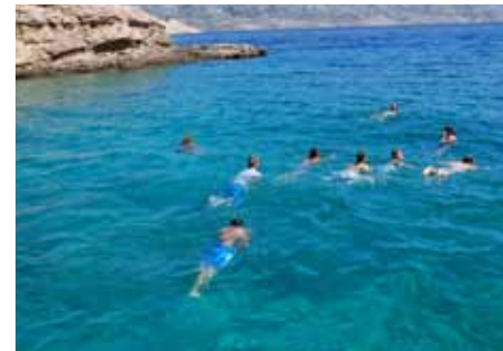
Erst einmal abkühlen: Das Foto wurde bei einer früheren Jugendfreizeit in Kroatien aufgenommen.

Wir zelten auf dem Campingplatz Oliwa, direkt an einer traumhaften Badebucht mit Kiesstrand. Untergebracht ist die Gruppe in Zelten für 6 bis 8 Personen. Die Zelte haben einen Holzfußboden und Betten mit Matratzen.