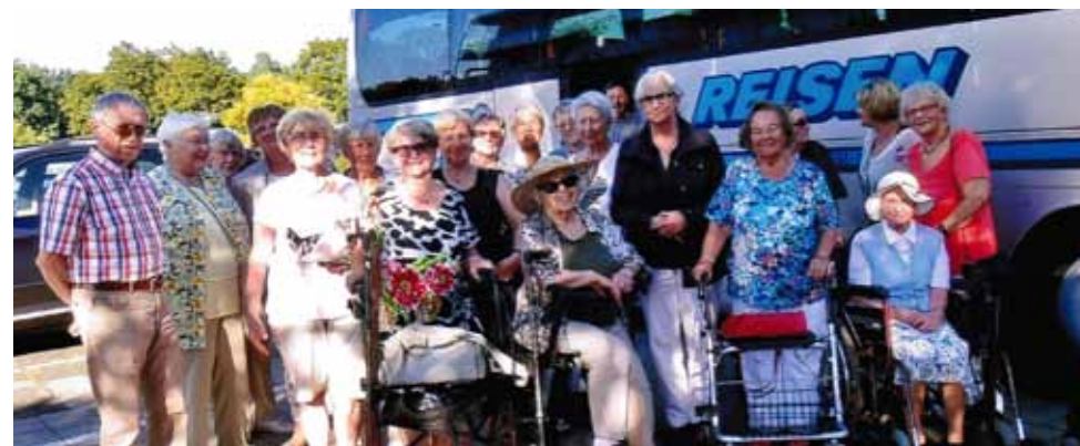
Sommerausflug vom Kaffeestübchen ins Kloster Seligenstadt am 17. August 2016