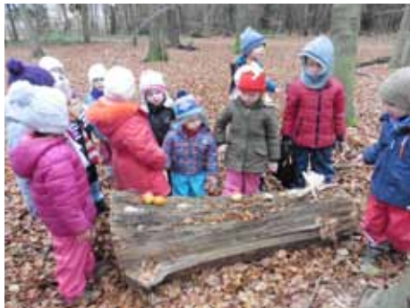
Unser Waldaltar

Können Sie sich erinnern? Am 11.12.2016 feierte unser Kindergarten im Rahmen unseres Kindergarten- Adventsgottesdienstes Waldweihnacht. Ein wunderbarer Gottesdienst, in dem die Kinder sich entschlossen, auch den Tieren im Wald Weihnachtsgeschenke zu überbringen. Die Walddtiere waren nämlich sehr nachdenklich geworden und fragten sich, ob das Christkind auch an sie denken würde. Warm eingemummelt machte sich die Kirchengesellschaft mit Laternen und Taschenlampen im Dunkeln auf den Weg. In einem Bollerwagen lauter Leckereien für die Walddtiere, steuerten wir ein Plätzchen im Wald an, unseren „Waldaltar“. Hier wurden lauter Leckereien deponiert. Äpfel, Nüsse, Mais und Stroh wurden hinterlegt, Lieder gesungen und von unserer Pfarrerin Frau Friedrich ein Segen gesprochen. So stapften wir nach vollbrachter Tat zufrieden zurück in unsere Gemeinde.